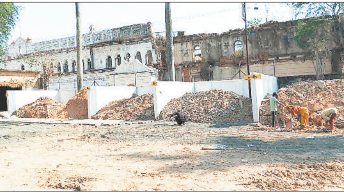
निर्माण के लिए समूह द्वारा किया गया कचरे का पृथकीकरण।