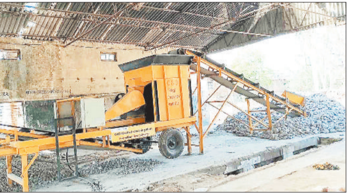
डिपो परिसर में स्थापित डी एण्ड एफ यूनिट।