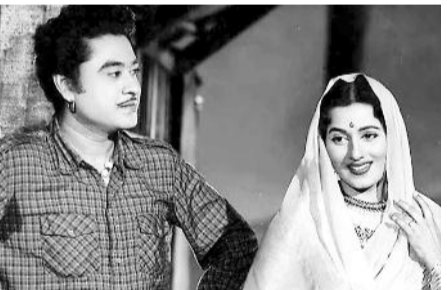
दुनिया से छुपाया बीमारी : उन्होंने बताया, मधुबाला को उस समय बीमारी का पता चला जब वह अपने करियर के शिखर पर थीं। उस वक्त उनके पास एक नहीं बल्कि कई प्रोजेक्ट्स थे। जो करियर में रुकना नहीं चाहती थीं। उन्होंने दुनिया से अपनी गंभीर बीमारी को छिपाते हुए काम करते रहने का फैसला किया। मधुबाला ने बीमारी के बावजूद खूब को पूरी तरह से काम में डूबी दिया। इस दौरान उन्होंने गुलन-ए-आजम में 'अनारकली' जैसी कई फिल्मों की शूटिंग पूरी की। कई बार वो सेट पर बेवैश हो जाती थीं, लेकिन इस मानसिक की कामना उन्हें चुकानी पड़ी।